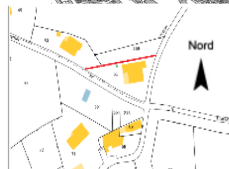
Projet d'installation d'une clôture